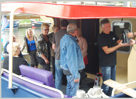
Op pad met de zeewolf