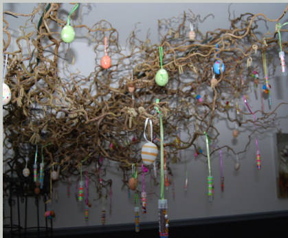
Onze wensboom in het inloophuis

Er zijn helaas ook mensen die door hun ziekte aan huis gekluisterd zijn, of die zich moeilijk kunnen voortbewegen. Deze patiënten zijn afhankelijk van anderen. Een uitje om even naar het inloophuis te mogen is dan heel waardevol. Kent u iemand, dan kunt u deze echt een groot plezier doen, door deze eens mee te nemen naar het inloophuis.