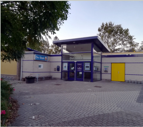
Inloophuis In de Stek in Grootebroek