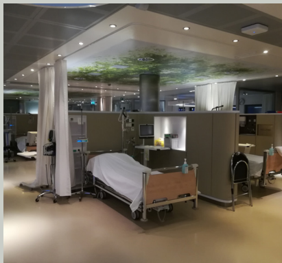
VU behandelcentrum Amsterdam, prima verzorgd

Als patiënt moet je soms voor langere tijd naar het ziekenhuis. Soms zelfs meerdere keren per week. Ziekenhuizen doen er alles aan om het u naar de zin te maken. Soms lukt dat bijzonder goed, zoals hieronder te zien is